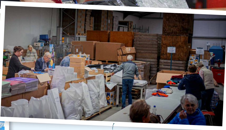
Vrijwilligers aan de slag in de loods in Ermelo