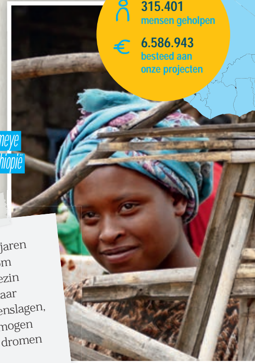
Emameye uit Ethiopië

315.401 mensen geholpen 6.586.943 besteed aan onze projecten